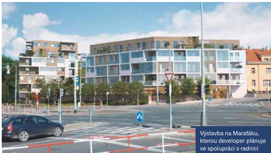
Výstavba na Maratáku, kterou developer plánuje ve spolupráci s radnicí

Náš program a důvěra voličů se staly trnem v očích ostatních stran, které se dostaly do zastupitelstva. ANO, ODS a TOP 09 se spojily a vytvořily koalici bez nás. Jejich zájmy jsou zcela jiné – s developery nechťejí mít žádné problémy, a proto jim všemožně vycházejí vstříc a umetají jim cestu, aby mohli realizovat projekty v plném rozsahu podle svých představ. Zájem občanů městské části jde v tomto smyslu na poslední kolej. Radnice kaše na občanské petice a uzavírá s developery různá memoranda o spolupráci. Dává jim souhlas s dotčením pozemků městské části, nepodává žádné připomínky do probíhajících územních řízení, neodvolává se proti rozhodnutím stavebního úřadu a podporuje změny územního plánu pro zástavbu rekreačních ploch bytovými domy.