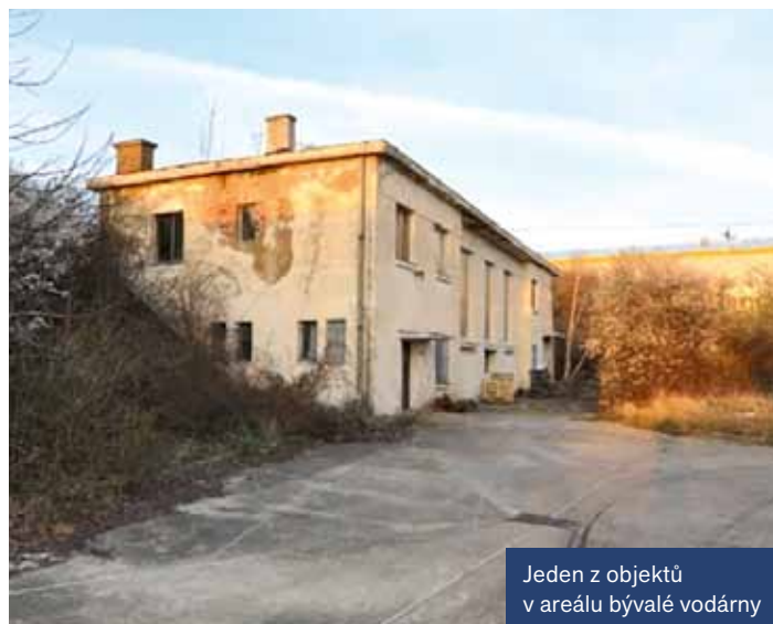
Jeden z objektů v areálu bývalé vodárny

U ž jste někdy slyšeli o „Chotejně“? To je areál bývalé vodárny, který se nachází v ulici V Chotejně v průmyslové části Hostivaře. Donedávna ho spravovala městská část Praha 15 s ročním výnosem z pronájmů ve výši 175 000 korun.